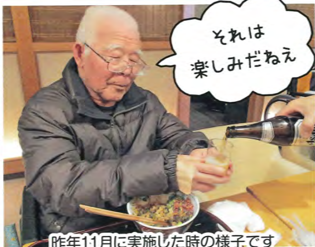
昨年11月に実施した時の様子です

二月二十日(木)、おこしもの作りを行いました。皆さん思い思いの木型に米粉をこねたものを押しこんで、個性豊かなおこしものが出来上がりました。出来上がったものは蒸し上げ、砂糖醤油につけて美味しく頂きました。