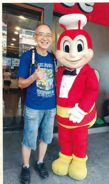
今は元気になりました

い、もう一度、病院で診てもらおうとも思いましたが、診てもらったのちに一日がかりになるのではないかと思い、薬をやめて様子を見ることにしました。幸いその頃には熱も下がり、喉の痛みも無くなっていました。1週間ぐらいすると予想通り、湿疹も消え、痒みも無くなりホットしました。私自身アレルギーはなく、今まで、日本の病院でもらった薬で「薬疹？」が出たことはなく、それが本当に「薬疹」です。