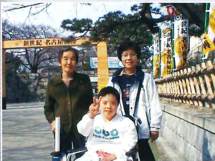
孫と嫁と名古屋城にて

かなくなり、東海福寿園ができた時にこちらに入所させてもらいました。それから12年、私も102歳となり、今は、毎週欠かさず会いに来てくれる、息子夫婦、孫に会うことが唯一の楽しみになっています。