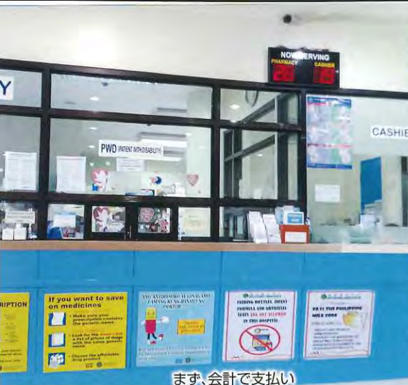
まず、会計で支払い

何でも「見てみよう」「体験してみよう」という5年前にダバオに来て以来の気持ちは、今も持ち続けています。そのような中、昨年の8月半ば、とうとう病院にかならなければならなくなりました。ミンタルで行われた「慰霊祭」（昔ダバオに入植した日本人の墓があり、毎年の行事になっている）に出席した後、帰りの車の中で、体がだるくなり、頭痛も、シートに座っていても、車が揺れるたびに、頭まで「ズキン、ズキン」と伝わって来ました。同行した方との食事会も早々に家に帰り、部屋で寝ていました。夜、目が覚めても一向によくならず、あくる朝、病院で診てもらうため、宿舎のメイドさんに付き添ってもらい、病院へ。こちらで病院で診てもらうことは、噂にも聞いていたので、よほどのことがない限り、行くことは避けたいです。しかし、その時ばかりは「藁にも縋る」の言葉通りの体調、やむを得ず診てもらうことにしました。病院に着く