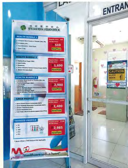
次に、検査室で採血・検尿